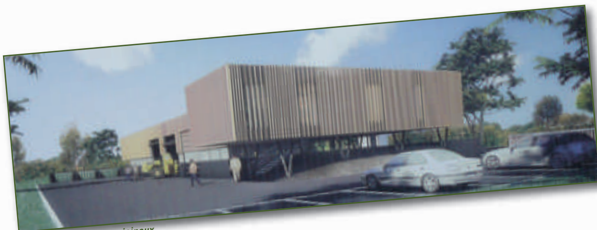
Projet des ateliers municipaux

Réalisations de travaux d'entretien sur l'ensemble des bâtiments municipaux.