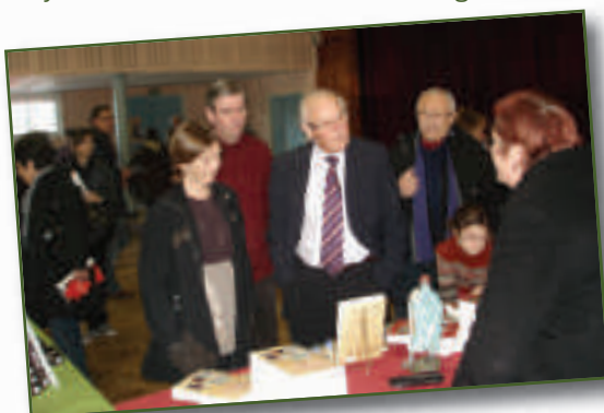
Salon du Livre

Pour conclure cette semaine, le samedi 30 janvier, le foyer rural accueillait la 11 e édition du salon du livre. Le public a pu découvrir les nombreux ouvrages présentés par ALICE MEGASTORE et des auteurs locaux.