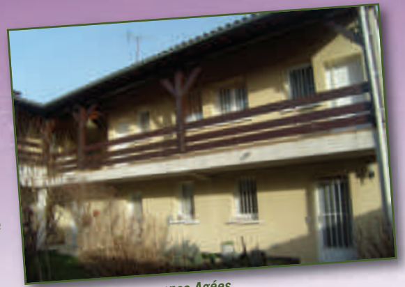
Résidence pour Personnes Agées

Inscription à la Mairie : 05 57 88 44 09