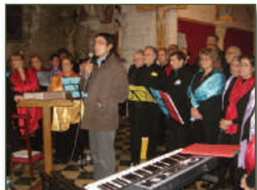
Concert de Gospel à l'église

La soirée continuait avec une représentation théâtrale de la troupe de nos voisins macaudais « les berges de Garonne » qui interprétèrent magnifiquement la pièce de Jacky LESSIRE «Y a des cales en bourg».