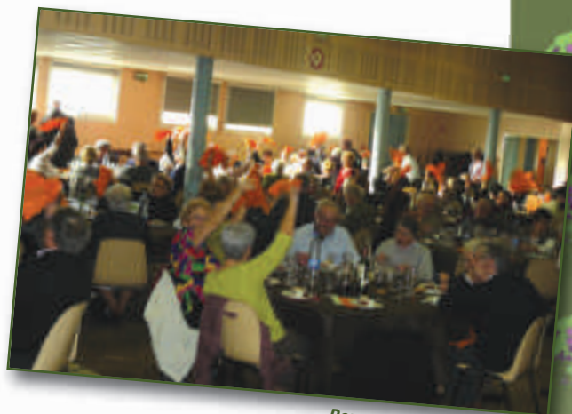
Repas des anciens

Les personnes malades ou ne pouvant pas se déplacer ont reçu la visite des membres du CCAS avec un panier garni de douceurs.